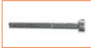
Śruba - Screw