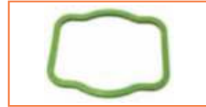
Uszczelka - Seal solenoid