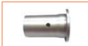
Prowadnica sprężyny - Spring guide