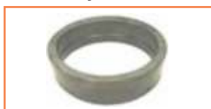
Tuleja - Bush