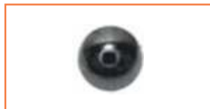
Kulka - Ball