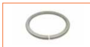
Pierścień - Spacer ring