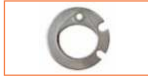
Podkładka uszczelniająca - Sealing washer