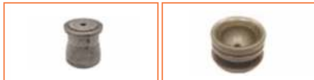
Przekładka - Thrust socket