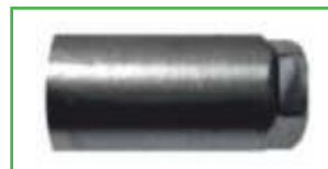
CRN 941 205