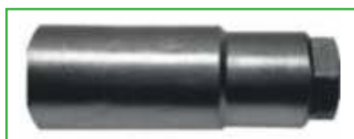
CRN 941 210

DO WTRYSKIWACZY PIEZO FOR PIEZO INJECTOR