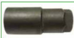
CRN 941 208