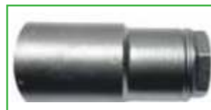
CRN 941 209