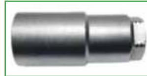
CRN 941 203